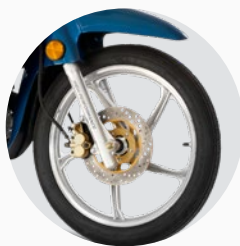
Freno delantero de disco.