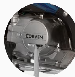
Mecánica confiable y probada.