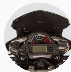
Tablero digital multifunción.