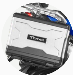
Set de valijas incluidas.

Tablero digital multifunción. Puerto USB.